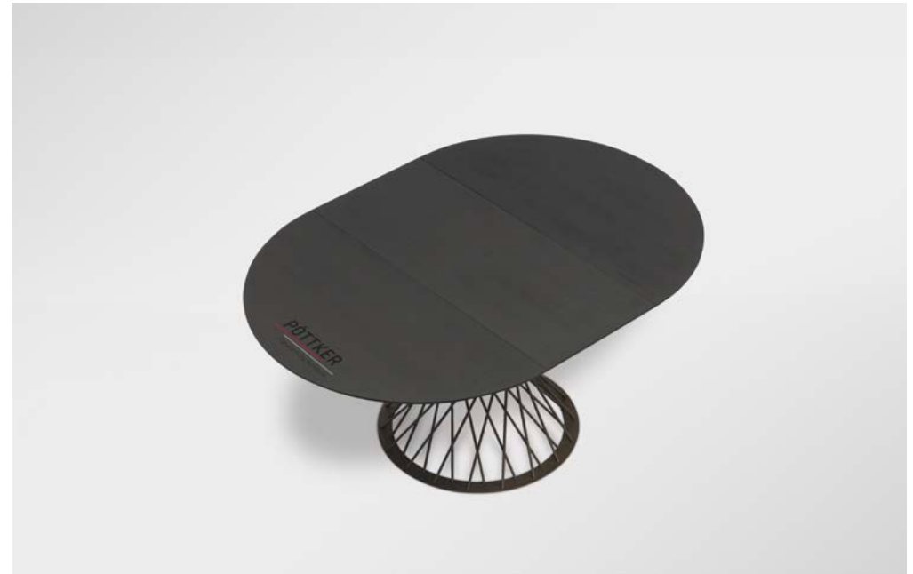
GEÖFFNET | OPEN