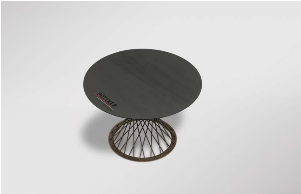
GESCHLOSSEN | CLOSED