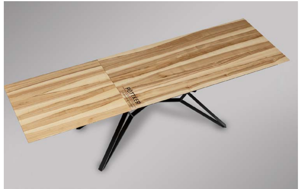
GEÖFFNET | OPEN