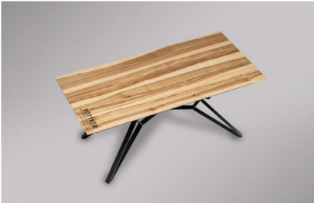
GESCHLOSSEN | CLOSED